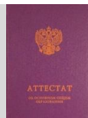
Оригинал или копия документа об образовании и (или) документ об образовании и о квалификации