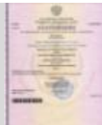
Оригинал документа иностранного государства об образовании и (или) документа об образовании и о квалификации, заверенный в установленном порядке переводом на русский язык документа иностранного государства об образовании и приложение к нему